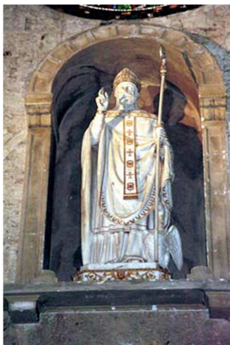
San Cervone. Cattedrale di Massa Marittima

Hè dunque interessante a so vita perchè chì, cum'è in un spechju, ci si pò leghje e grandi quistioni matriculate da l'Auropa di tandu, è chì frastornanu ste cuntrate in particolare.