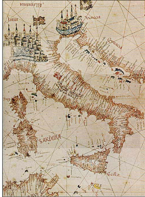
Carta marina di Bartolomeo Parete, XVu seculu.

È perciò quandu chì Maumettu II strinse l'assediu nant'à Custantinòpuli, ùn ci fù nisunu per vene à a so riscossa, è cusì cascò in u 1453.