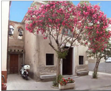
Chjesuccia Santu Mamilianu. Isula d'Elba.

Valente, furzutu è capace ma dinò propriu spietatu cù i so avversarii, ferma à listessu tempu u solu in gradu di prutege e custere, non solu in u circondu u più vicinu ma ancu fin'à in Civitavechja, à u puntu di diventà “amirale di u Papa”, ciò chì palesa assai di e difficoltà di prutege isse cuntrate, è di un certu viotu di pudere.