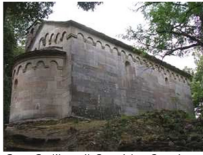
San Quilicu di Cambia, Corsica.