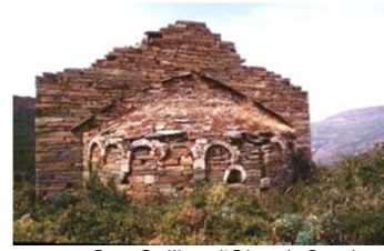
San Quilicu d'Olciani, Corsica.