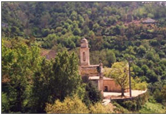
San Cervone di u Poghju d'Oletta, Corsica.

Quandu chì pè qualchì mutivu l'integrazione si fecia difficiule, i cummercianti si pudianu ancu mutà in pirati ... ma à l'epica era quessa cosa naturale !