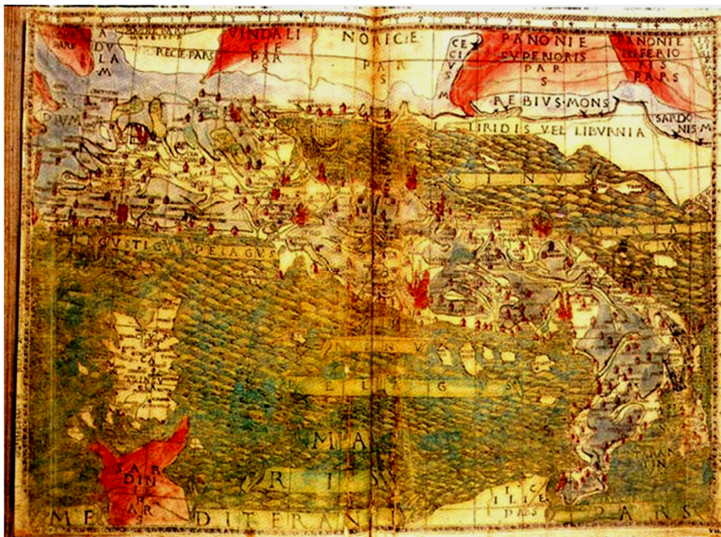
Carta di l'Italia di Tolomeu, 1477.