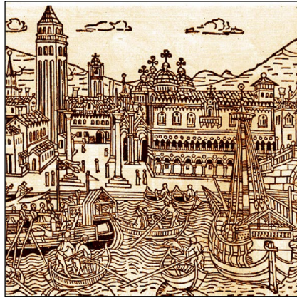
Venezia, stampa di u 1400.

In questu u cuntestu s'eranu perpetuati i cummerci trà Corsica è Maremma, sempre cusì cuntinui, intensi è di forte attività, prima sott'à a custodia di u pudere pisanu, poi ghjenuvese. Piccule nave è grande sperenze sulchighjavanu u Tirrenu purtendu u vinu di Corsica, ma dinò i so tanti è tanti emigranti chì da pìccoli cummercianti, da artigiani di u coghju è di a lana, da carbonaghji o piscadori è mercanti a si pruvavanu à buscà si una vita più asgiata pè issu cuntinente (5) duve u spupulamentu dopu à e frebbe endèmiche avia apertu belli spazii da arrughjunà si.