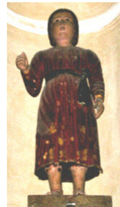
San Quilicu, Vallica, Corsica

Frà altre cose hè ancu testimoniata sta bella intensità di i raporti fin'à u Medievu da u cultu di Santu Mamilianu, San Cervone è San Quilicu chì adduniscenu l'isule tuscanu à a Corsica in un'unica devuzione, accennata da itinerarii chì accertanu l'esistenza d'antichissime strade commerciale aduprate da omi è mercanzie chì passavanu da una sponda à l'altra senza alcuna difficoltà. Accertanu dinò tanti scartafacci ch'in Maremma fin'à u XIVu seculu sbarcava da Corsica ligname, vinu, pesci, furmagliu, carne salita è granu. Di règula i Corsi eranu integrati bè in Maremma, sin'à diventà ancu citatini distinti in parechje cumunità, cum'ella hè dimustrata pè Piumbinu è Capuliveri. Di listessu modu fecianu cummerciu i Maremmani pè Calvi, Campulori, Bunifaziu cù stoffe di linu o di cànapa, mantelli di lana (chjamati baracani), oliu, sale è ferru.