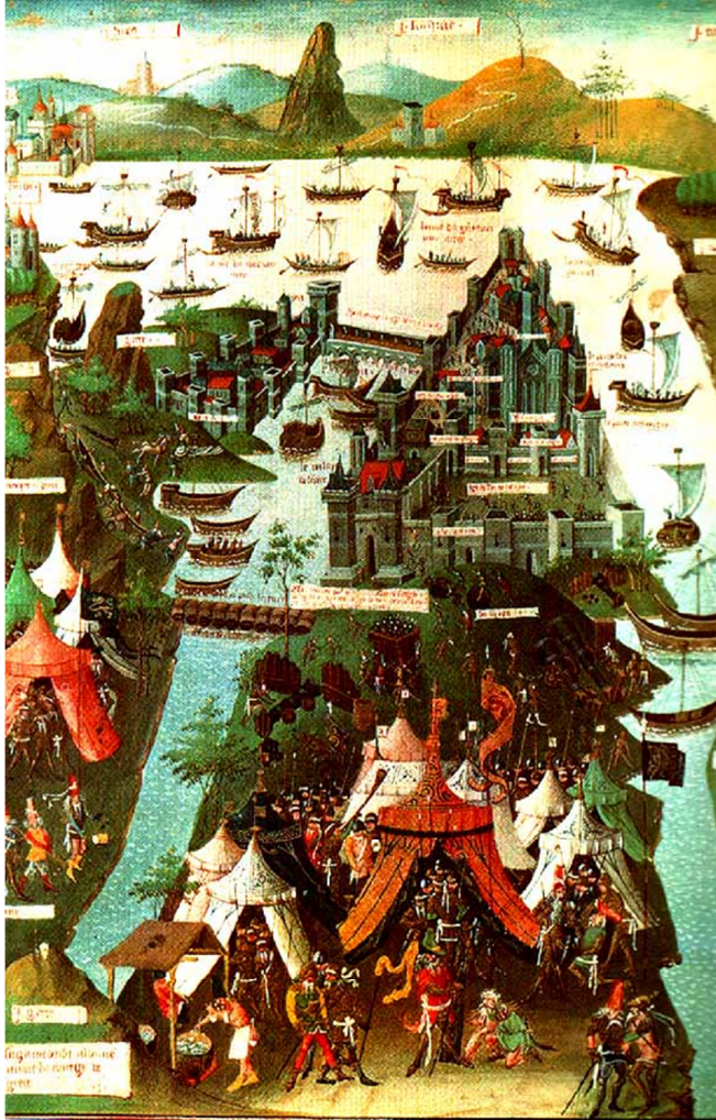
Constantinòpuli, assediata da Maumettu II, 1453.

In u XVIu seculu era Ghjènuva patrona di stu mare, anzi tuttu di a Corsica. Ma a so putenza marittima, a lampava sempre di più luntanu da e so sponde, per via d'una cuncurrenza di più in più forte cù a Spagna, in tempi chì u Terraniu era sempre sulchighjatu da tamantu tràfficu pè e so rotte principale.