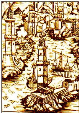
Ghjenova. Lanterna è fanale.

Turnava u Mare Terraniu ad esse, dopu tanti sèculi, una terra di cunfine :