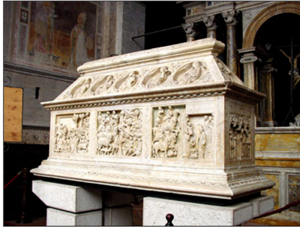
Arca di San Cervone. Cattedrale di Massa Marittima.