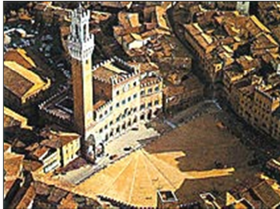
Siena, Piazza del Campo.

In questu u cuntestu s'eranu perpetuati i cummerci trà Corsica è Maremma, sempre cusì cuntinui, intensi è di forte attività, prima sott'à a custodia di u pudere pisanu, poi ghjenuvese. Piccule nave è grande sperenze sulchighjavanu u Tirrenu purtendu u vinu di Corsica, ma dinò i so tanti è tanti emigranti chì da pìccoli cummercianti, da artigiani di u coghju è di a lana, da carbonaghji o piscadori è mercanti a si pruvavanu à buscà si una vita più asgiata pè issu cuntinente (5) duve u spupulamentu dopu à e frebbe endèmiche avia apertu belli spazii da arrughjunà si.