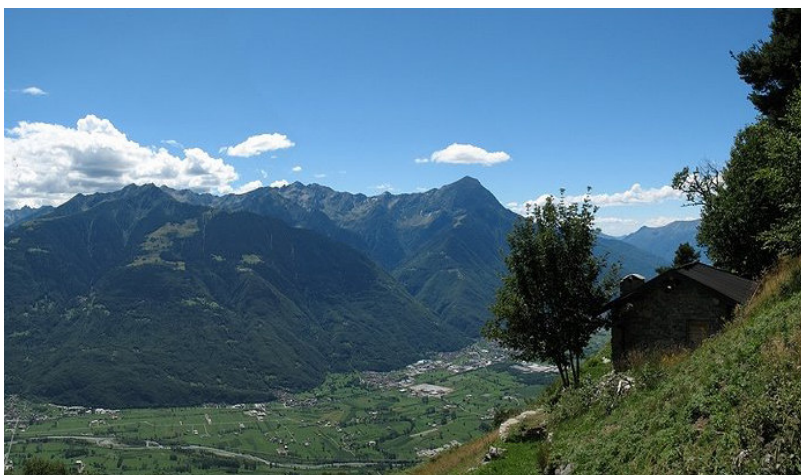
E valle ticinese

A pace d'Augusta di u 1555 trà protestanti è cattòlici avia stabbilitu u cuncettu " cuius regio, eius et religio ", vale à dì : a ghjente deve seguità a religione di u so prìncipe. A libertà religiosa era ricunnosciuta solu à i prìncipi, micca à u pòpulu. In u sèculu XVI duve nacque u fundamentu di u dirittu pùbblicu, era dirittu di u capu di Statu di pudè impone a so propria religione à i so sugetti.