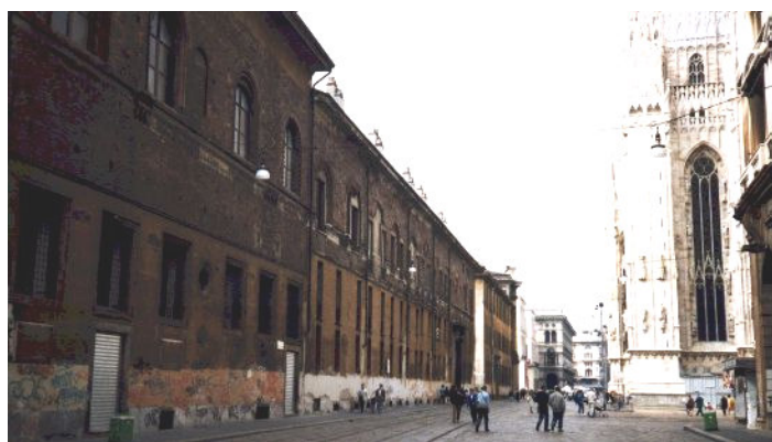
U palazzu arcivescovile di Milanu

Pare ch'è per qualch'è tempu u giòvanu cardinale avessi pensatu di scioglie si da tante faccende ch'è u ligavanu à u Papa, in quella corte romana ch'è ùn lu tenia tantu, è à ritirà si in una vita cuntemplativa ind'è l'ordine di i Camaldulesi. Ma fù dissuasatu da u vescu di Braga, Bartulumeu de Martyribus, venutu in Roma da Trentu di settembre di u 1563. Stu sant'omu avia sustenutu à u cunciliu ch'è u grave duveru di i veschi era di guvernà e so diòcesi è di fà ci cuntinua residenza. Fece capì à u giòvanu cardinale ch'è a funzione pasturale ùn hè solu un cuntinuu exerciziu di e più alte virtù. Fù de Martyribus à incità à Borromeo à ùn rifiutà micca l'arcivescovatu di Milanu, ch'è u Papa li l'avìa attribuitu " in commenda ", è di ch'è Carlu avia pigliatu pusessu pè l'intermezu d'un pricuradore à a fine di ferraghju di u 1560.