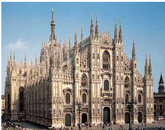
U Domu di Milanu

Carlu Borromeo volse marcà u principiu di a so residenza in a so diòcesi cù un esempiu cuncretu di disinteressu. Francescu Cusani, un sturianu làicu, misuratu è precisu di parulle, in u primu volume di a so Storia di Milanu stampatu in u 1861, scriveva : " Carlu cuminciò cù un luminosu esempiu di disinteressu, rinunciendu à un rèdditu annuale d'un milione trecentu cinquantamila lire chì venia da terre, benefizii è pensioni à ellu versati da u Papa. Ne cunvertì una parte à prò di u pòpulu, impieghendu la pè innalzà utili è grandiosi edifizii ". Cusani si riferisce à dui testimonii di proprii ochji, Bascapè è Giussano. Giussano dice : " Di dòdecì abbazie è tante pensioni ch'ellu pussedia, à tutte ci rinunciò, une poche in libera manu di l'Altissimu Pontifice, d'altre l'impiegò à collegii