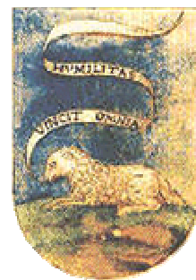
U blasone di l'ordine di l'Umiliati